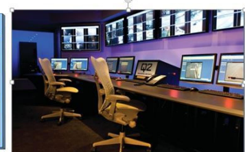
Cybersecurity Operational Center (CSOC)

Security Affairs Institute vanta inoltre collaborazioni internazionali con Enti di Ricerca ed Università in Europa, Stati Uniti, Giappone, Cina, Medio Oriente, Israele.